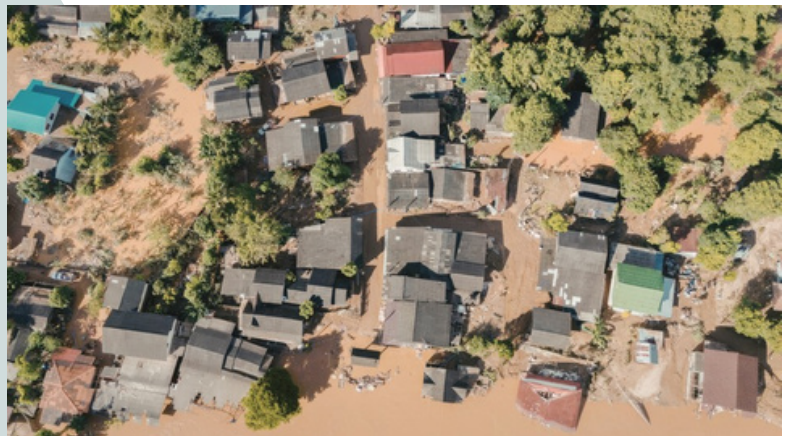
El cambio climático está provocando episodios recurrentes de inundaciones extremas en todo el mundo.